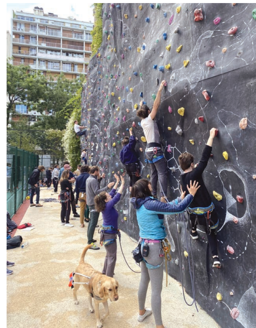
Les adhérent·es de 11C+

Tout cela ne se fait pas sans mal. Une de nos difficultés est de s'adapter à tout en gardant le cap de nos fondamentaux associatifs. Nous sommes passés de 10 membres à 120 en quelques années, avec un renouvellement de 30 % par an, comme tous les clubs d'escalade de la FSGT. Les sorties et les réunions festives sont alors les moments privilégiés pour démontrer notre projet et faire adhérer les nouvelles et les nouveaux.