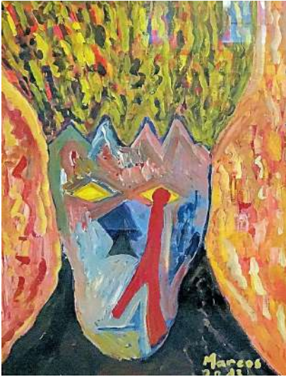
GUERREIRO de SOUSA dit Marcos « Paysage dans la tourment » (Huile)

Vous faites de la photographie, du dessin ou de la peinture ? Vos oeuvres pourront être publiées dans un prochain TVS à accueil@fsgt75.org