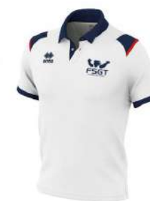
Le polo 16 €

Contacts : accueil@fsgt75.org ou 01 40 35 18 49