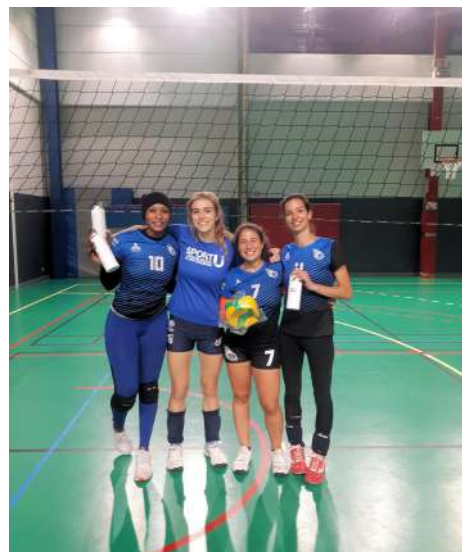
L'équipe SMASH GIRLS