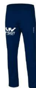
Pantalon 17 €

Le Comité de Paris propose sa tenue sportive officielle. Elle est disponible au secrétariat dans toutes les tailles. L'ensemble (veste, polo, pantalon) = 51 € pour femmes et hommes de la taille S à XXL.