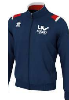
La veste de survêtement 23 €