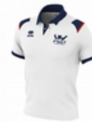
Le polo 16 €