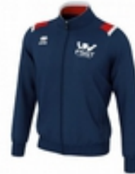
La veste de survêtement 23 €

Le Comité de Paris propose à tous ses sportif.ve.s une nouvelle tenue sportive officielle à l'effigie du Comité. Elle est disponible au secrétariat du Comité de Paris. Au choix :